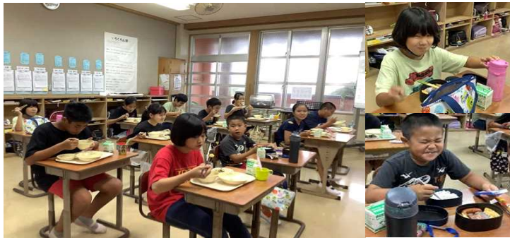
【給食時間は2名のみさきっ子(自主登校)も一緒に過ごしました。】 【1学期終業式の様子】 (7月31日・金)