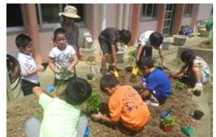
[ 正門前のプランター ]