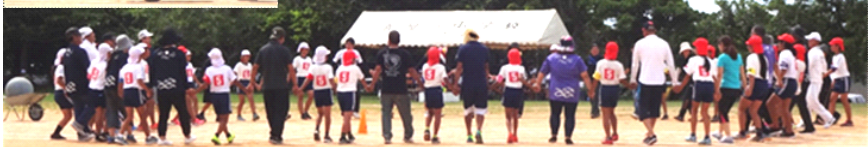
[ みさきっ子一人一人の協力する姿・最後まで頑張る姿がありました ]