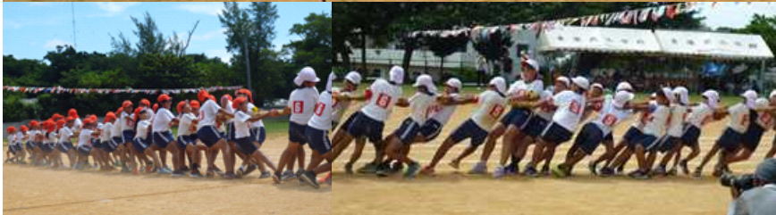
[ 運動会テーマ ・ 入場行進 ・ 綱引き ]