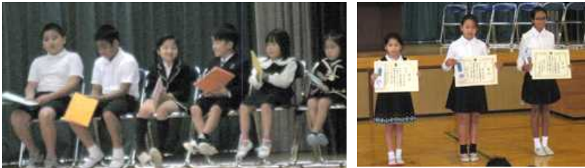
【発表代表者のみなさん】