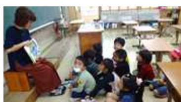
【6年生：必読図書読書】