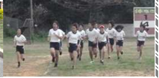
[6年生 最後は全員でゴール]