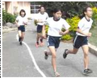
[軽やかな6年生の走り]

糸満市教育の日・学校公開日に実施した校内持久走大会 1・2年生は600M 3・4年生は800M 5・6年生は 1000Mのコースでしたが、参加したみさきっ子全員が完走 しました。保護者の皆さまの応援もありがとうございました。