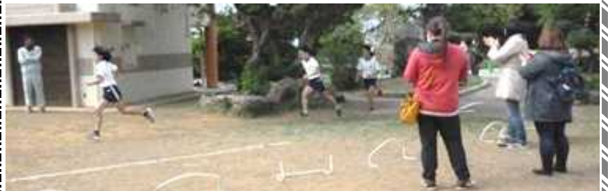
[保護者のご声援ありがとうございました]