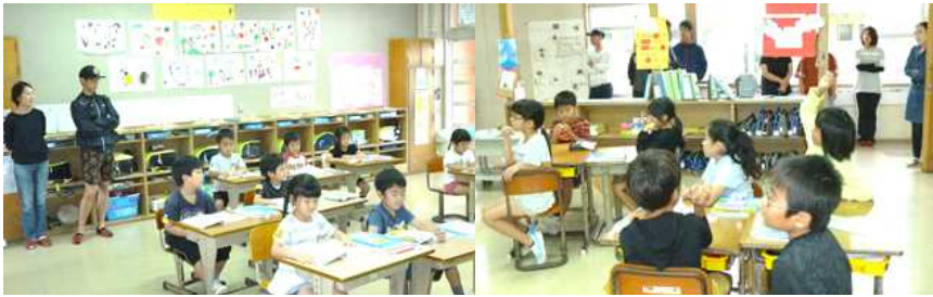
[ 1年生の教室 ]