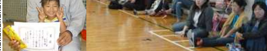
[ 3年生の教室 ]