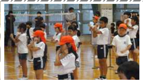
[ 全体で準備運動 ]