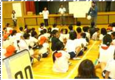
[ 開会式 ]