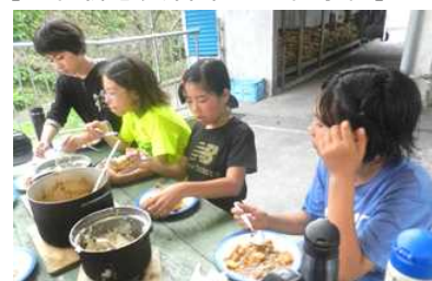
【おいしいカレーに満足】