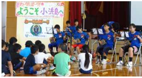
【小浜小学校5・6年生と交流会】