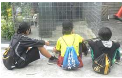
【途中、犬に癒やされ元気もらう】