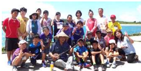
【小浜でお世話になった方々】