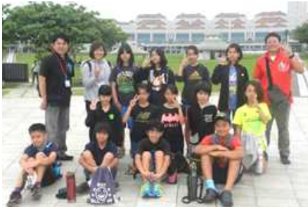
【平和祈念資料館で平和学習】

2日目は野外ウオークラリー、保護者の協力も頂き全員迷うことなくゴールすることができました。ご協力に感謝します。