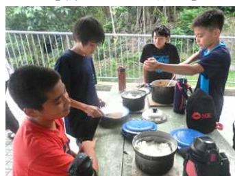
【ご飯も上手に炊けてました】