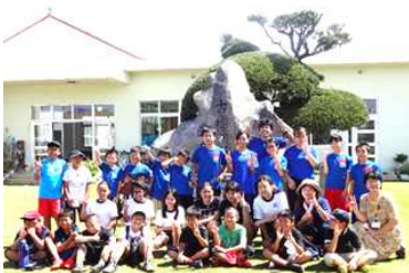
【校舎をバックに記念撮影】