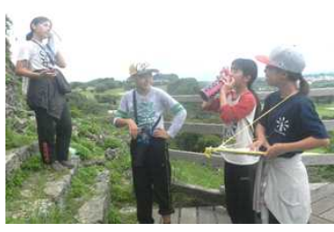
【無事にゴール 暑かった!】