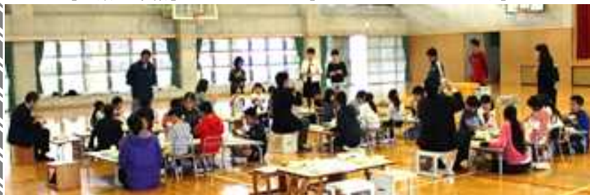
[みんなで、いただきます]