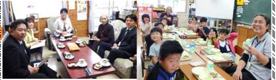
[校長室で話し合い]