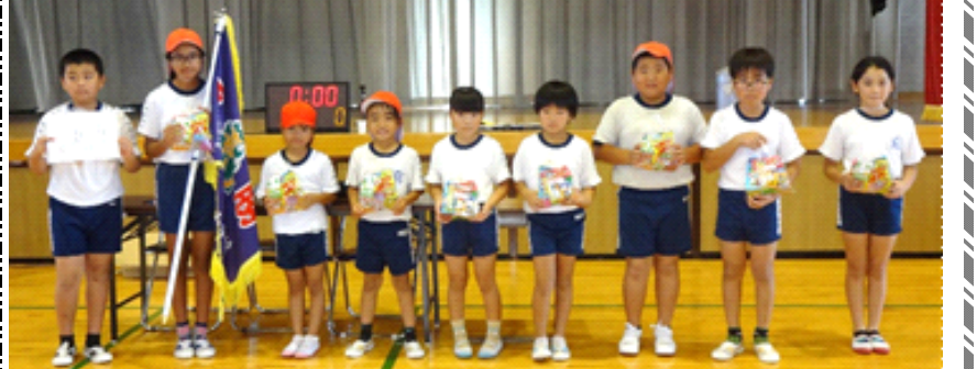
[優勝：サルビアチーム]