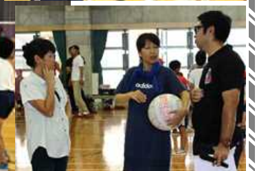
[笑いあり・珍プレーあり、ボールに振り回され楽しかった]