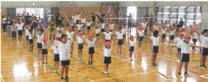
[準備運動で身体ほぐし]