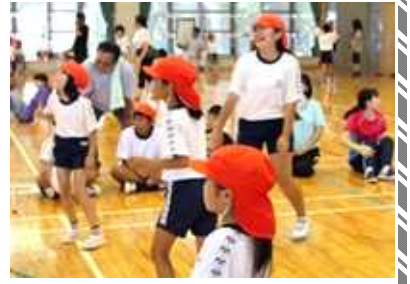
[各チームとも応援で盛り上げる]