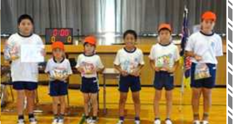
[準優勝：まつぼたんチーム]