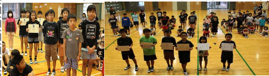
4年生快挙↑ [全国書画展覧会全員受賞] [歯の処置完了の皆さん↑]

2学期を振り返って、こども園・1・3・5年生の代表のみなさんが、運動会や学習発表会(生活発表会)等、頑張ったことを発表してくれました。下記は延べ142名の表彰式受賞の様子です。