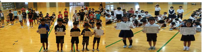
[体力優良児受賞↑] [地区読書感想画感想文受賞↑]