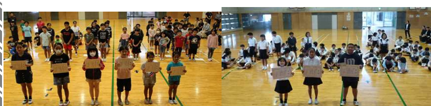
[家庭学習がんばりノート受賞↑] [偕生園コンクール受賞↑]