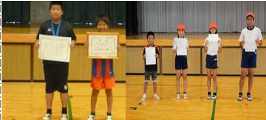
【三和ジュニア・三和FC各大会にて受賞】 【体力測定高得点判定表彰者】