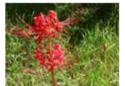
[秋を告げる 彼岸花]