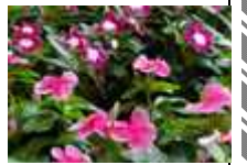
[ にちにち草 ]