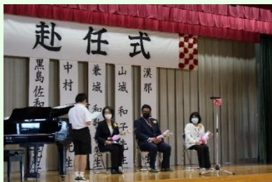
児童代表歓迎のあいさつ:〇〇〇〇さん