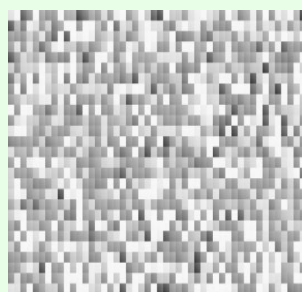
よろしくお願いします