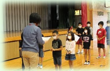
*苗字を略しています。ご了承ください。