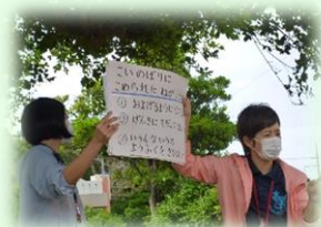
<こいのぼりクイズは、大盛り上がり>

昨年度は休校中で掲揚式は行えませんでした。今年も晴天のもと、1年生~3年生までのみんなで♪こいのぼり♪を歌ったり、クイズに挑戦したりしました。校長先生からは、「大空に泳ぐこいのぼりのように元気に育てほしい」「元気に育ててくれるおうちの人に感謝してほしい」の2つを伝えました。2年ぶりの大空で泳ぐこいのぼりも心地よい風をうけてとてもうれしかったです。