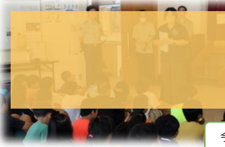
今日の避難訓練の講評を聞きます