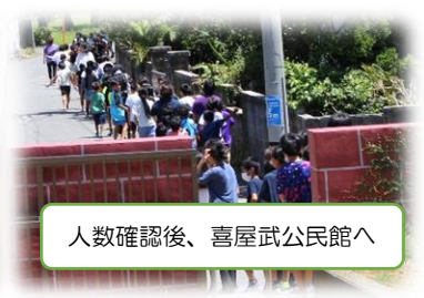
人数確認後、喜屋武公民館へ