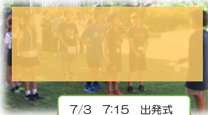
7/3 7:15 出発式